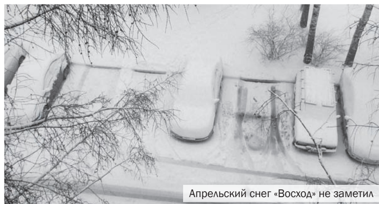
Апрельский снег «Восход» не заметил

Через три недели после вступления в силу нового порядка уборки внутриквартальных территорий почти никто из гореловцев и красносёлов так и не увидел в своих дворах уборщиков компании-подрядчика.